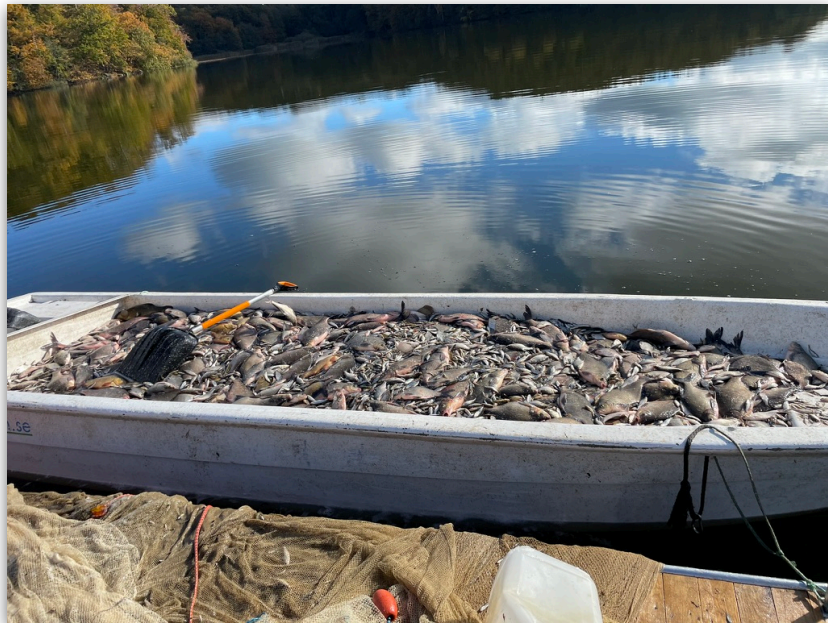
Figur 4. Fångst i ett av notdragen i oktober 2025