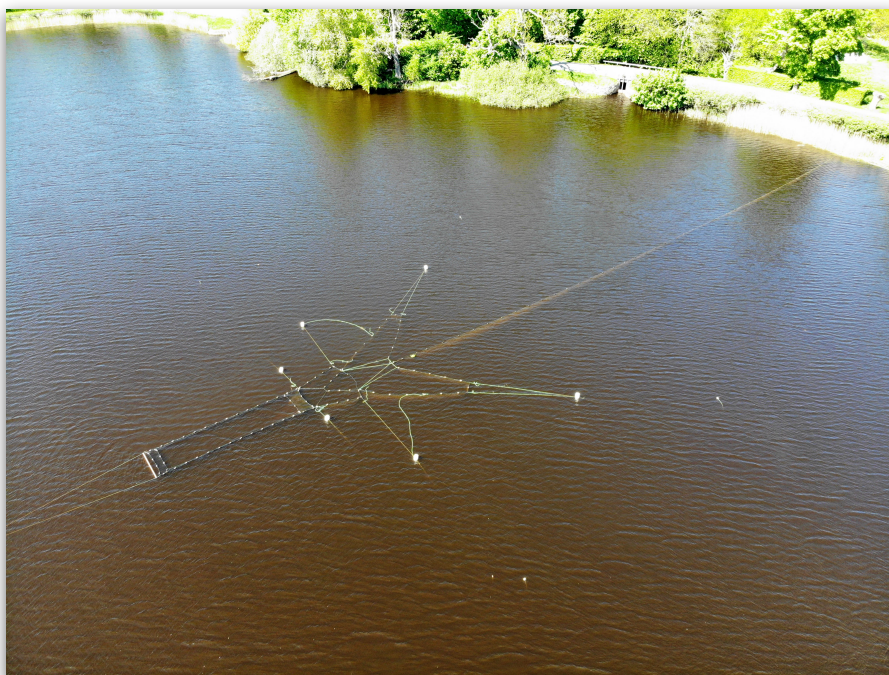
Figur 1. Bottengarn i Häckebergasjön våren 2018. Från land går en landarm som hindrar fisken från att simma förbi. Landarmen leder in fisken i fångstanordningen där fiskhuset i detta fall är uppbyggd som en öppen box.