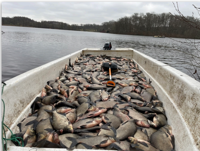
Figur 5. Fångst i december 2025 på ett notdrag.