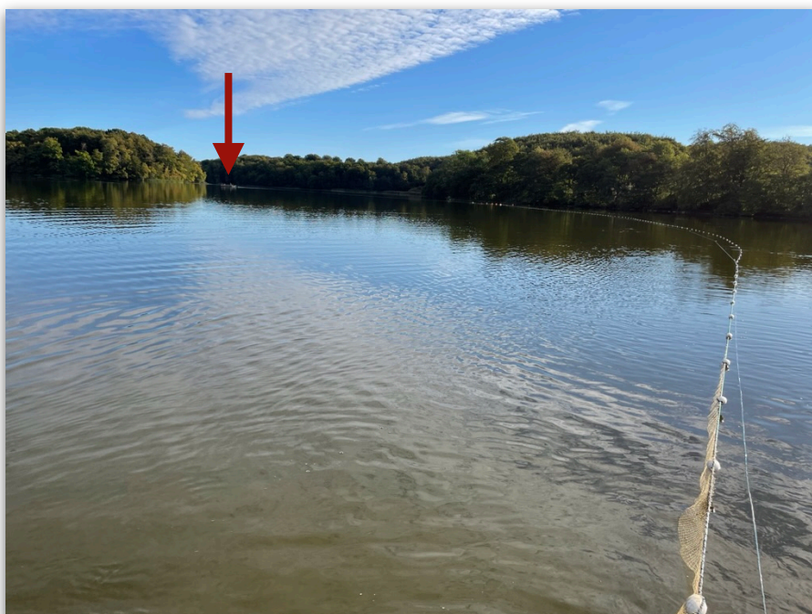
Figur 2. Nottfiske i Häckebergasjön hösten 2022. Den 340 meter långa noten läggs ut med hjälp av båt och flottar och ett område på ca 4 hektar fiskas av. Fisken hamnar till sist i notsäckken som är placerad i mitten av noten där fisken ligger kvar i vattnet tills den håvas upp. Pilar visar var andra änden på noten är.